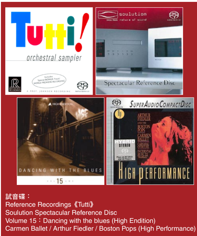
試音碟： Reference Recordings 《Tutti》 Soulution Spectacular Reference Disc Volume 15 : Dancing with the blues (High Endition) Carmen Ballet / Arthur Fiedler / Boston Pops (High Performance)